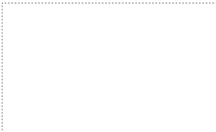
PC版バナー掲載位置