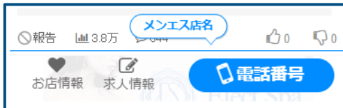
↑SPオーバーレイ 特別仕様 (メンエス版)

※前日の途中開始はありません。2営業日前 (17時厳守) までに完了できない場合は、通常通り1日0時開始となります。